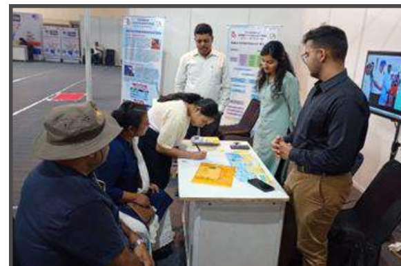
At "TV9 Education Expo 2025" on 24th to 25th May, 2025 at Maniram Dewan Trade Centre, Guwahati